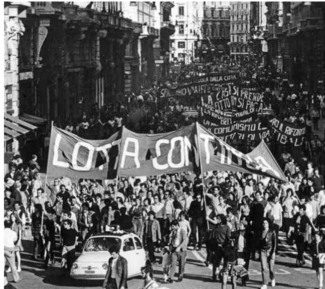
Der Kampf würde immer weitergehen, dachte man damals, bis zum Sieg

„Den Linken gelang die Anpassung an die neuen Verhältnisse nicht“